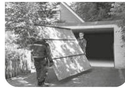
Ausbau und umweltgerechte Ent- sorgung