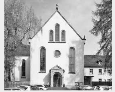
ST. JOSEF, FRANZISKANERKIRCHE