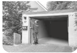
Aufmaß vor Ort