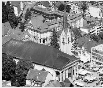
STADTPFARRKIRCHE ST. MARTIN