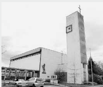
ST. CHRISTOPH, ROHRBACH www.pfarre-st-christoph.at