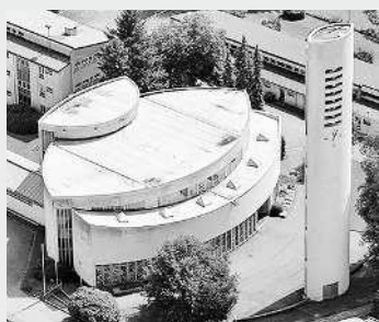
BRUDER KLAUS, SCHOREN www.kath-kirche-dornbirn.at/ pfarren/schoren