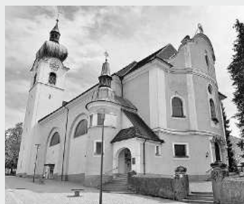
ST. SEBASTIAN, OBERDORF

Weitere Detail: www.pfarre-hatlerdorf.at