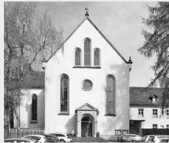
ST. JOSEF, FRANZISKANERKIRCHE