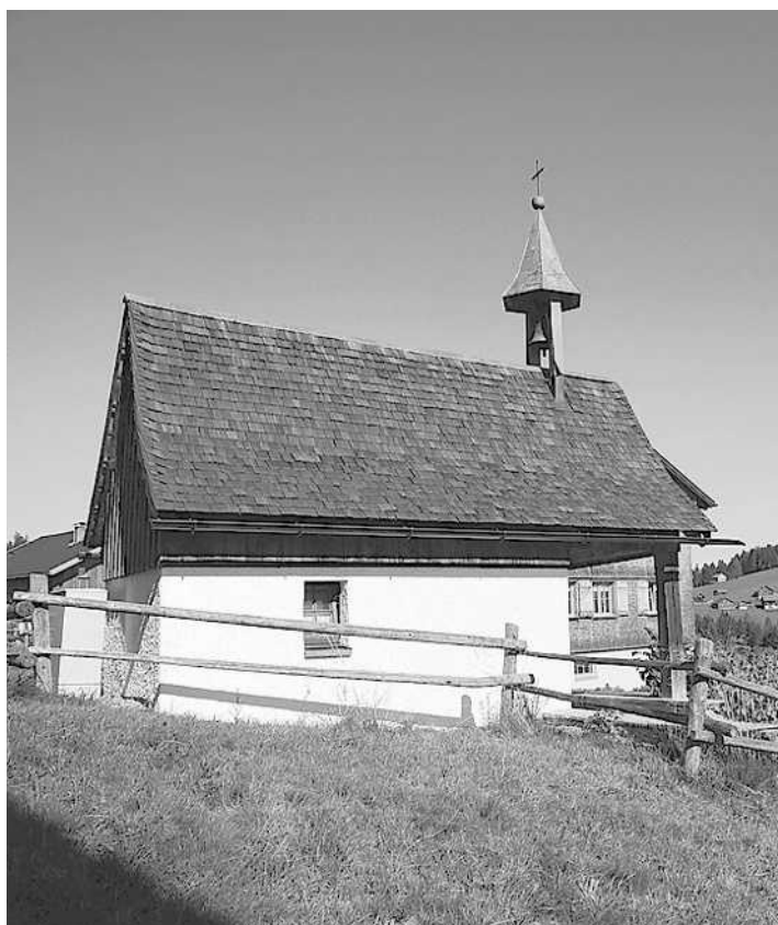
Kapelle hl. Maria, Weißtannen, Schwarzenberg

Bitte beachten Sie, dass auch bei unseren Veranstaltungen die 3G-Regel (getestet, geimpft, genesen) und die Maskenpflicht gelten.