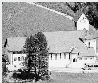
HL. MARIA MAGDALENA, EBNIT www.kath-kirche-dornbirn.at/ pfarren/dornbirn-ebnit