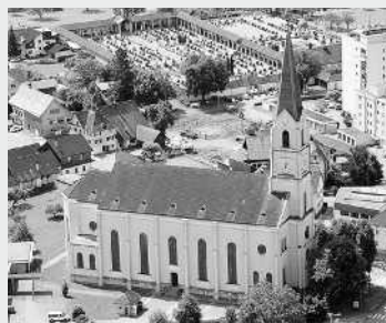
ST. LEOPOLD, HATLERDORF www.pfarre-hatlerdorf.at