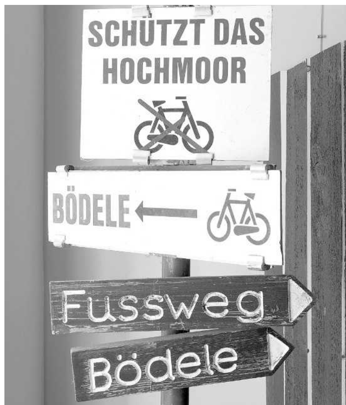
Wegweiser vom Geißkopf in Richtung Bödele

Die Bödele-Ausstellung wird Corona bedingt verlängert. Wir freuen uns über Ihren Besuch auch am Wochenende und dürfen Sie wieder bei Veranstaltungen begrüßen! Mehr unter www.stadtmuseum.dornbirn.at