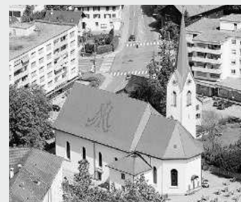
MARIÄ HEIMSUCHUNG, HASELSTAUDEN