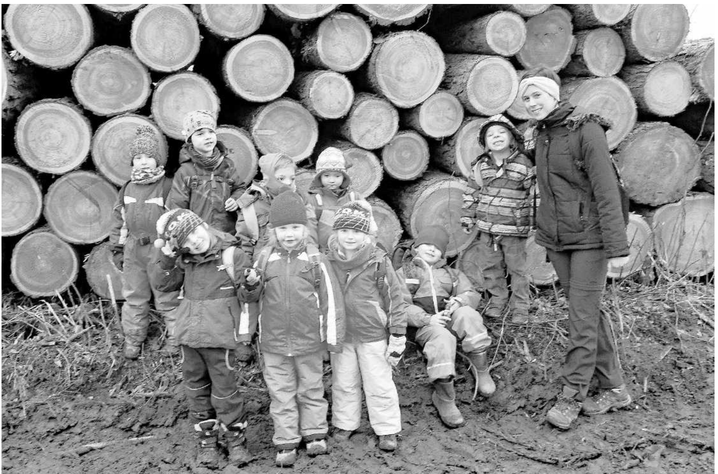
Der ESK-Freiwilligendienst ist eine der vielen Möglichkeiten, wie Jugendliche Europa entdecken und erleben können.

Weitere Informationen und Details zur Europäischen Jugendwoche finden Interessierte unter: www.aha.or.at/jugendwoche