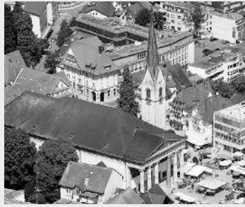
STADTPFARRKIRCHE ST. MARTIN