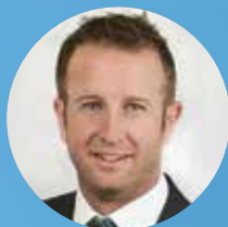
Christian Hagspiel Filiale Hatlerdorf