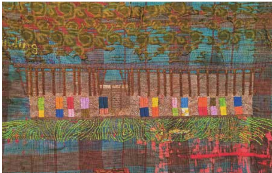
Miet School

Sie interessiert sich nicht nur für die Umsetzung ihrer Entwürfe, sondern auch für die Lebensumstände der zukünftigen Nutzerinnen und Nutzer, wie auch für die ökonomischen und kulturellen Bedingungen der Orte, an denen sie baut. Ihre intensive Beschäftigung mit Bangladesch bezieht also ganz selbstverständlich das dortige Wirtschaften der Textilindustrie und dessen Auswirkungen mit ein.