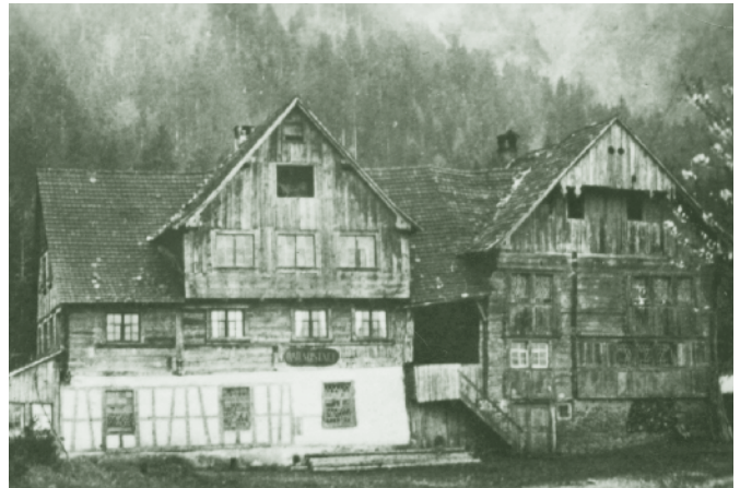
Gasthaus Bad Haslach um 1900

Über die Haldengasse geht es nach Mühlebach, das einen wunderschönen Dorfplatz hat. Kapelle, Gasthaus Schiffle, Josefs Lädeler, das ehemalige Gasthaus Traube, urige Bauernhäuser. Schön ist dieser Dorfplatz auch bei Weihnachtsmärkten oder Faschingsveranstaltungen. Über die Haslachgasse geht es dem Berghang entlang hinunter ins Bad Haslach. Vor 150 Jahren war hier noch reger Kur- und Bäderbetrieb. Damals hätte sicher niemand