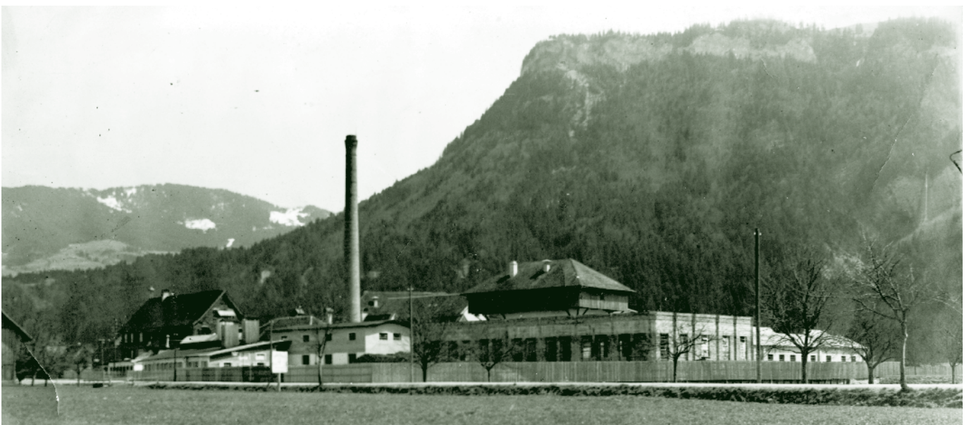
J.M. Fussenegger, Wallenmehd um 1930

Ich wünsche allen Stubatlesern, die auf dem E-Bike oder mit etwas Kondition mit dem normalen Fahrrad diese Tour fahren möchten, viel Spaß!