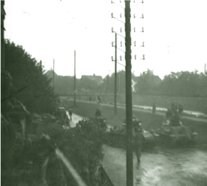
Französischer Panzer in Schmelzhütten, 1945