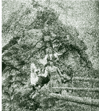
Wanderer um 1930