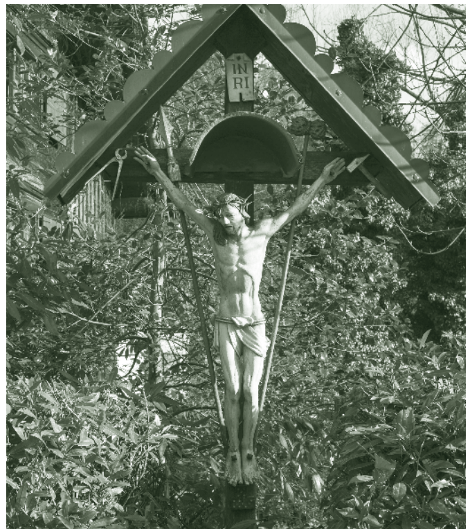
Arma-Christi-Kreuz in der Kehlerstraße

Stadtmuseum Dornbirn 6850 Dornbirn, Marktplatz 11 stadtmuseum@dornbirn.at