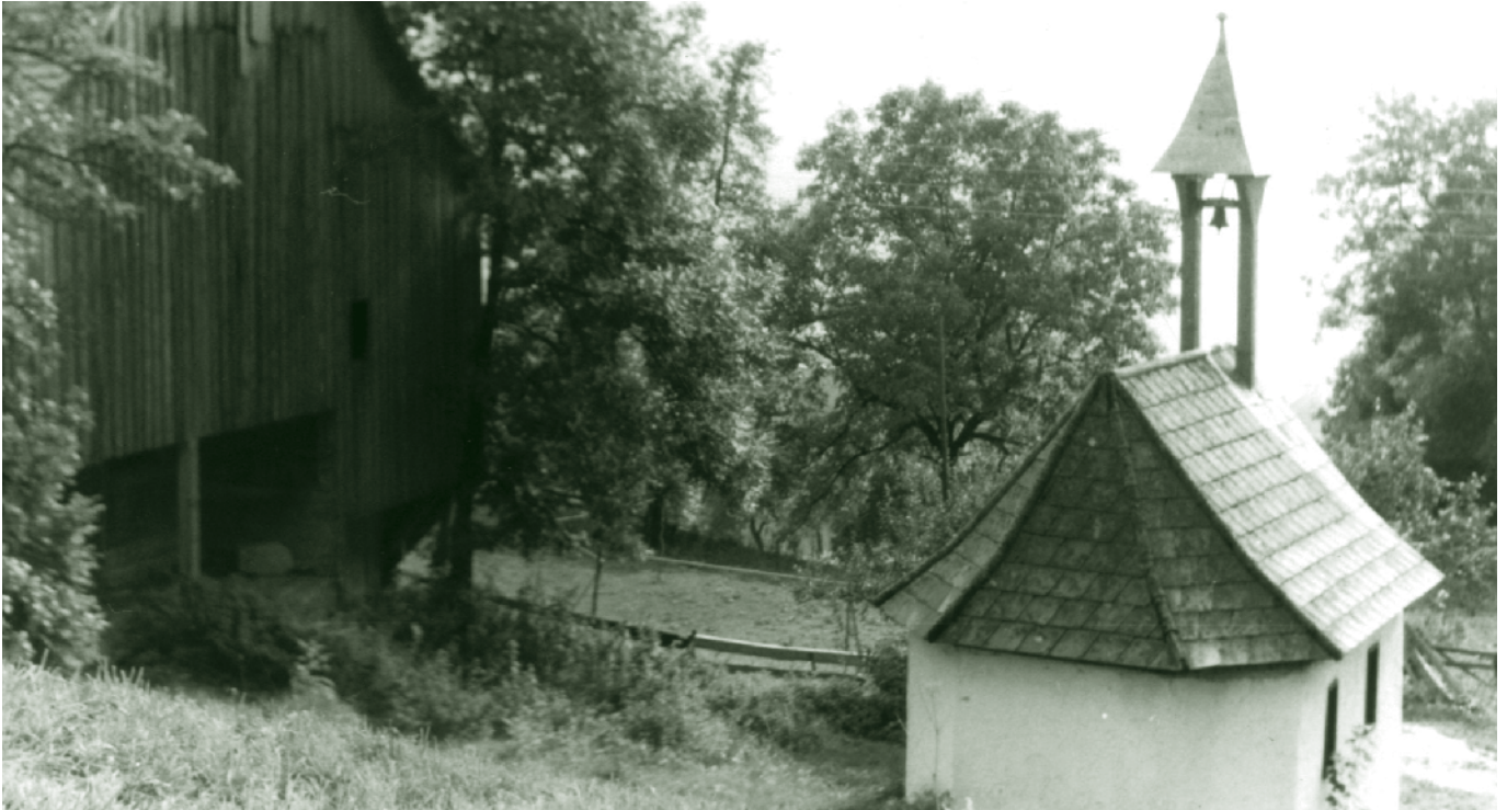
Kapelle Schauner, 1974

Nun wandern wir auf der hohlwegmäßigen Straße zur Parzelle „Schauner“ und erreichen die höchstgelegene dauernd bewohnte Bergparzelle am Oberdorfer Berg. Zusammen mit Schwendebach gehört sie zum ältesten Dornbirner Siedlungsgebiet. Die Kapelle zur Hl. Maria soll nach einer Inschrift 1674 erbaut worden sein und zählt somit zu den ältesten Kapellen Dornbirns. Sie wurde 2009 rundum erneuert.