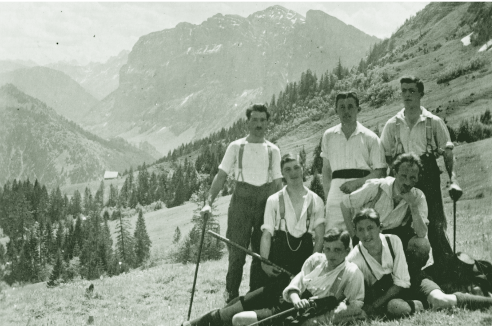
Blick in den Bregenzerwald um 1930

Mit und für Senioren gestaltete Zeitung der Stadt Dornbirn September 2016/Nr. 88