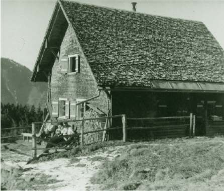
Bergheim Gütle um 1950