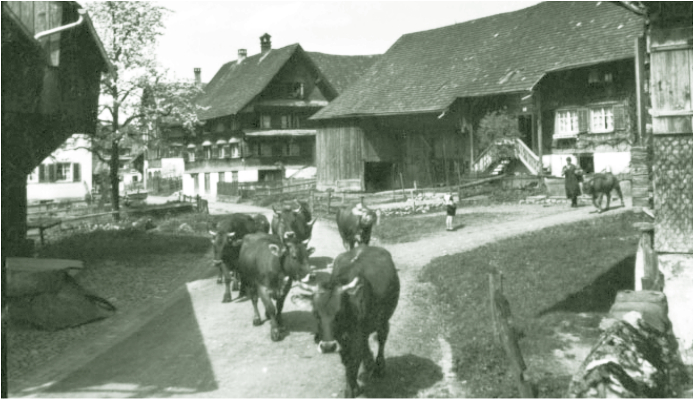
Haslachgasse beim Brunnen um 1950

ganz neues Industrie- und Gewerbegebiet mit zwei Dutzend Firmen, darunter die Spedition Transkona mit etwa 100 LKW. Auch eine Holzverarbeitung mit vielen LKW-Transporten ist dort. Die Zubringerstraße ist viel zu schmal und für Radler ungemütlich. Nachdem ich bis zur Brücke beim Landgraben gefahren bin, kehre ich auf der schmalen Straße wieder auf die Bleichestraße zurück.