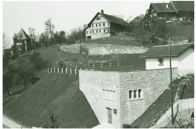
Wasserspeicher im Weppach - 1954

Hurtig fahre ich den Steinebach hinunter über die Bergstraße in die Sebastianstraße. Links vor