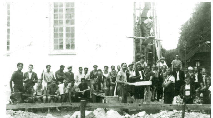
Renovierung der Kapelle Kehlen