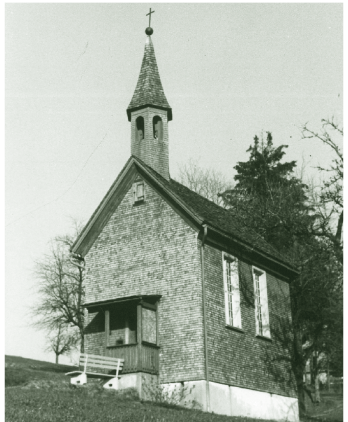
Kapelle Ammenegg um 1970