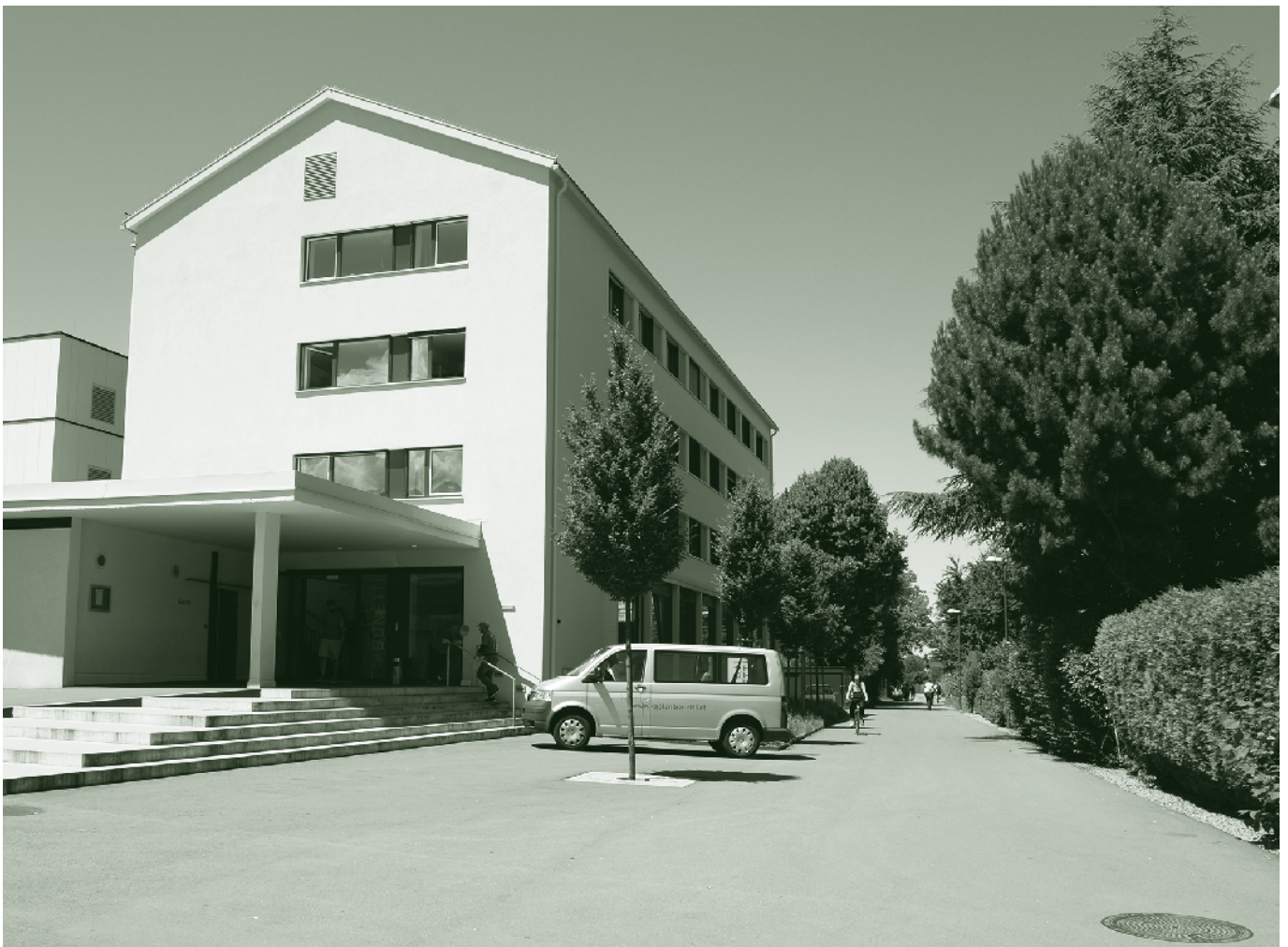
Die neue Kaplan-Bonetti-Straße beim ehemaligen „Haus der jungen Arbeiter“