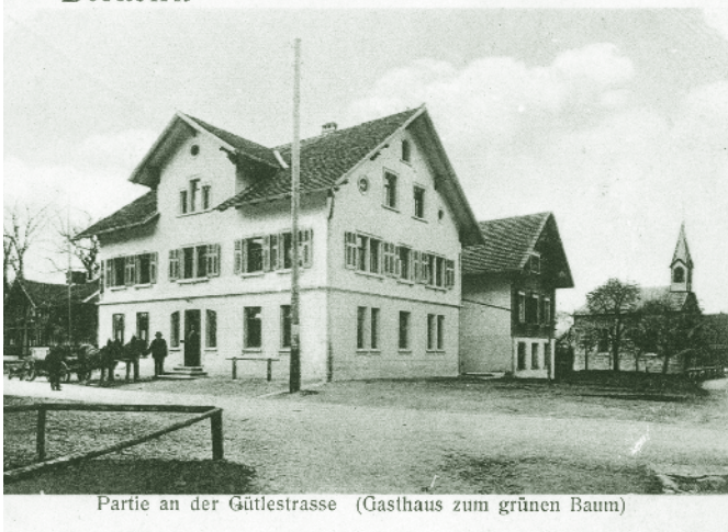
Partie an der Gütlestrasse (Gasthaus zum grünen Baum)