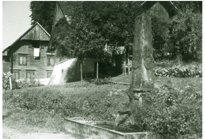
Kehlerstraße mit Franzosenbrunnen um 1950

Daran schließt sich das Fischerhüsle vor dem Weiher an.