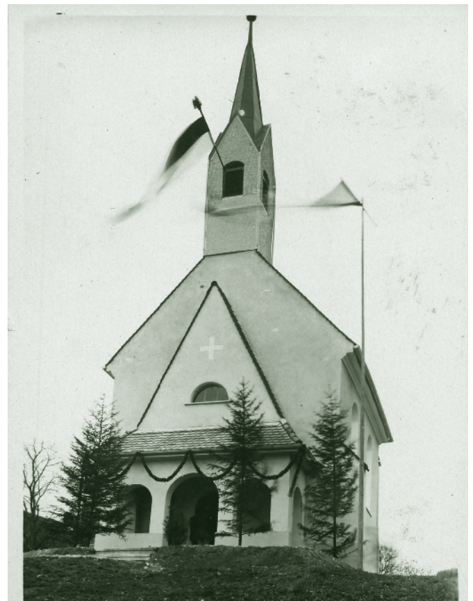
Kapelle Oberfallenberg nach der Renovierung um 1930