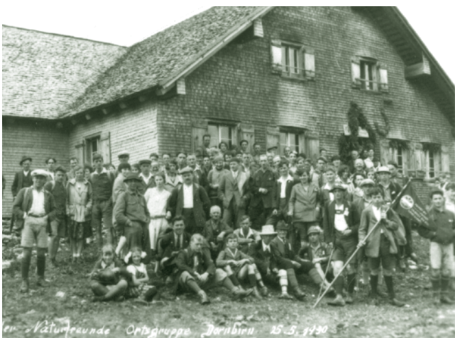
Naturfreunde vor der Alpe Weißenfluh um 1930

Die Familie Madlener sieht ihre Alpe vor allem als einen Ort der Begegnung, der Erholung und des