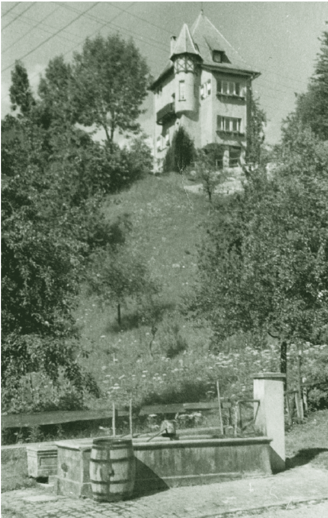
Pinselburg Kellenbühel um 1930

Nun erscheint das Steinebachareal, der Hauptsitz der Textilfirma F.M.Hämmerle. Ich durchfahre dieses Areal bis zum oberen Ende, folge der Abzweigung nach Eschenau und bin nun am höchsten Punkt meiner Fahrt auf etwa 530 m Seehöhe angelangt. Die 80 Höhenmeter von zuhause bis hierher habe ich dank E-Bike locker bewältigt. Das Steinebachareal mit seinem Mix von Ärzten, Physiotherapeuten, Steuerberatern, Rechtsanwälten, Seminarakademien sowie Handels- und Produktionsbetrieben zeigt eindeutig, dass aus der ehemaligen Textilfirma F.M.Hämmerle heute die größte private Immobilienfirma der Stadt geworden ist.