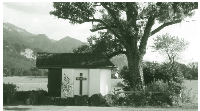
Antoniuskapelle „Lange Mähder“

Vorbei am Messepark und dem neuen Bürohaus M11 sowie dem Panoramahaus geht es über die Messekreuzung in die Josef-Ganahl-Straße. Links Kika und Metro, dahinter OBI, rechts dicht besiedeltes Häuser- und Wohnanlagegebiet. Die Josef-Ganahl-Straße bildet hier die Bebauungsgrenze. Links ein paar Bauernhöfe, rechts Sackgassen, die sich rasant der Josef-Ganahl-Straße nähern. Ich