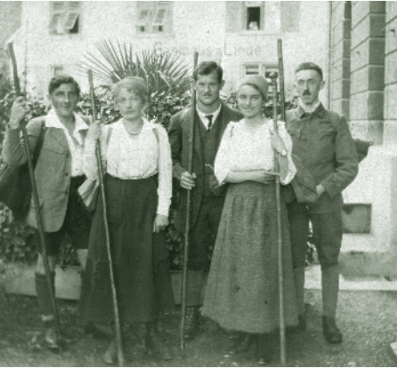
Wanderer beim Aufbruch um 1910