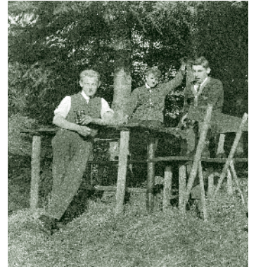
Kurze Rast um 1930