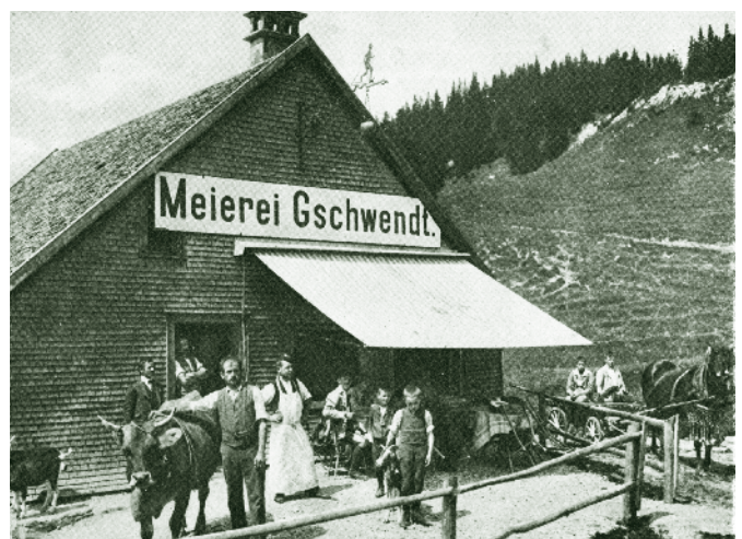
Meierei Gschwendt um 1910