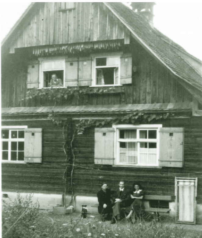
„Fischerhüsle“ Bündtlitten um 1930

Von meinem Wohnsitz aus geht es über die Falenberggasse und Kehlerstraße in die Bündtlitten. Hier fallen mir auf der linken Seite die schon über 100 Jahre alten, denkmalgeschützten, nach englischem Vorbild gebauten Arbeiterwohnhäuser auf. Man sieht, dass in der damaligen Zeit noch verschwenderisch mit Grund und Boden umgegangen werden konnte, vor den Häusern befindet sich jeweils pro Einheit ein großer Gemüsegarten. Die Gärten werden heute noch von den Bewohnern mit viel Liebe gepflegt. Auch die in den 50er-Jahren erbauten neuen Wohnhäuser wurden harmonisch in das bestehende Bild eingefügt, allerdings mit Rasenfläche anstatt Gemüsegarten.