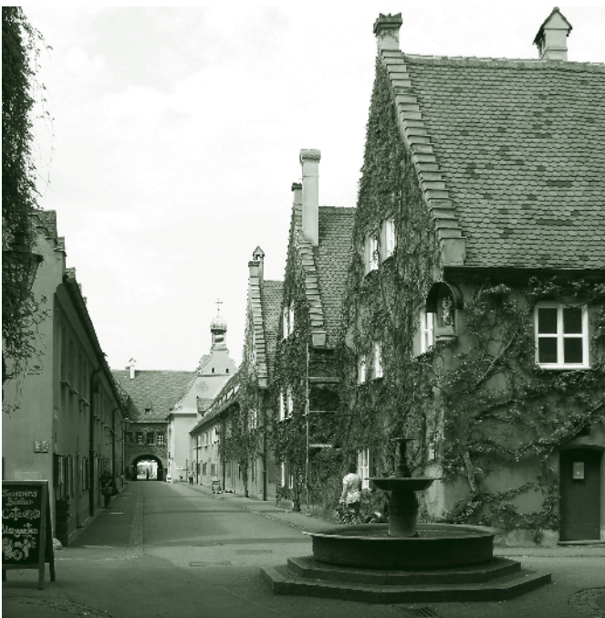
Die „Fuggerei“ in Augsburg

An die ereignisreiche Vergangenheit der Stadt Augsburg erinnern bedeutende Bauwerke der Renaissance in der Innenstadt, die Sozialstiftung Fuggerei und auch ein Textil- und Industriemuseum.