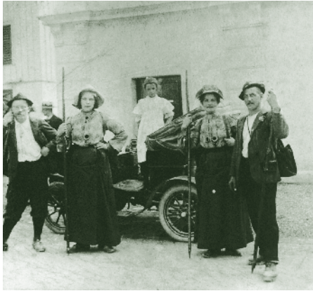
Vor dem Gasthaus Gütle, 1904