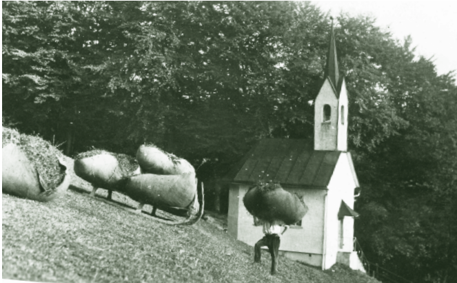
Kapelle Romberg um 1930

Wir setzen unsere Wanderung über Bantling nach Watzenegg fort und zweigen nach der „Alten Sennerei“ links auf die Straße nach Palmern ab und erreichen nach einem steilen Anstieg das „Gimsköpfe“. Der Gims war jahrelang ein beliebtes stadtnahes „Skigebiet“. Die Abfahrten vom Gims-