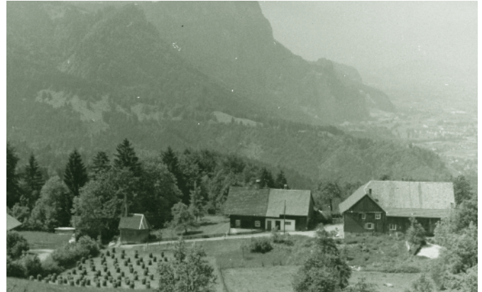
Swendebach um 1970