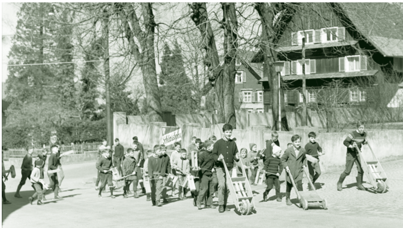
Rätscha und Klepfa um 1960