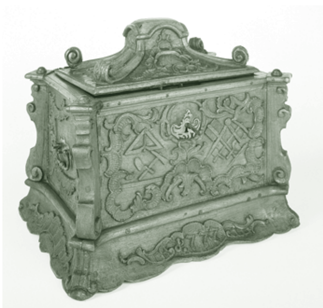
Zunftlade im Stadtmuseum - 18. Jhdt.