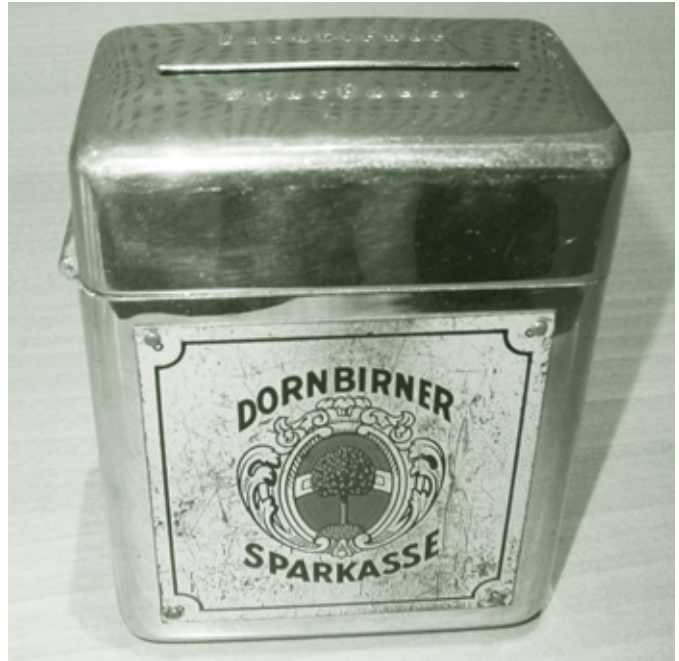
Sparkäsele, im Besitz der Dornbirner Sparkasse

In der Realschule gab es keine Schulspaktion mehr und so brachten wir unser Käsele am Weltspartag zum Leeren in die Sparkasse. Natürlich übten die Geschenke zum Weltspartag eine große Anziehungskraft aus. Was immer ich auf die Seite brachte, ging aufs „Büochle“. Das Sparbuch behielt ich als Notgroschen bis zum Ende meines Studiums im Jahre 1969. Dann wanderte der Inhalt in die Finanzierung unseres neuen Hauses. Mein Leben lang war ich ein konservativer Sparer. Sparbuch, Bausparkasse und Lebensversicherung waren die Säulen, auf denen ich aufbaute und ich habe immer versucht, meinen Kindern beizubringen, dass man zuerst etwas auf die Seite bringen muss, bevor man sich etwas leisten kann. Von mir aus müsste es keine Schuldenkrise und keine Privatkonkurse geben.