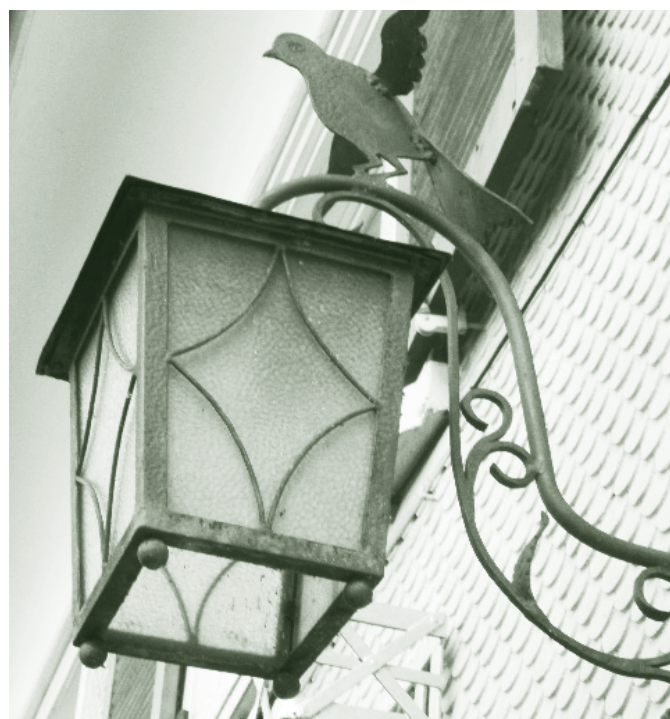
Hauslampe, ehem. Gasthaus Taube, Kehlerstraße 38

Meine Mutter hielt uns weiter zum Zwecksparen an und als nächstes durften mein Bruder und ich unsere Ersparnisse für zwei Kupferkessel, die als Blumentöpfe für unser neu renoviertes Gasthaus gebraucht wurden, hergeben. Sie wollte uns auch in die Freude der neuen Investition einbinden, denn bei einem Investitionsvolumen von 100.000