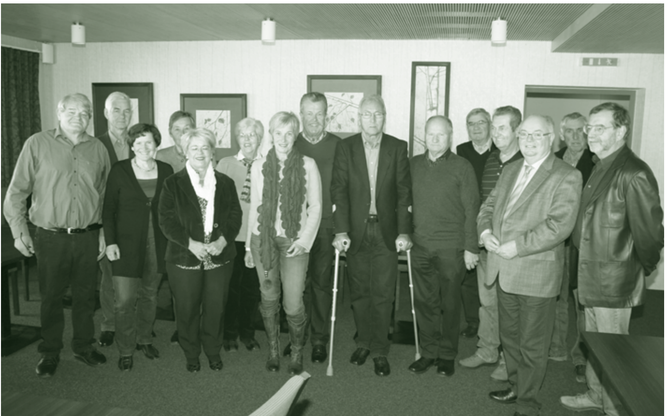
Die Gründungsveranstaltung der Senioren Börse fand im Dezember auf dem Karren statt.

Senioren Börse Dornbirn Treffpunkt an der Ach, 2. Stock Höchsterstraße 30 6850 Dornbirn www.seniorenboerse-dornbirn.at senioren.boerse.dornbirn@gmail.com Telefon: 0650 595 2686 und 0650 595 2687 Öffnungszeiten: Jeden Montag von 8.30 bis 11.30 Uhr