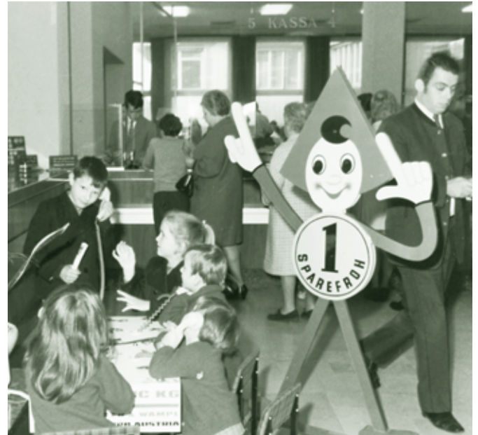
Weltspartag, Dornbirner Sparkasse - 1970-er Jahre

geschenk machen könnten. Mit schauspielerischer Fähigkeit stimmte er Klagelieder an über das Eisschlecken und die Kaugummiautomaten. Er wäre ein guter Lehrer gewesen, aber da er mit seinen sieben Kindern zu Hause fast eine kleine Schulklasse gegründet hatte, konnte er seine Fähigkeiten dort einsetzen. Nicht unerwähnt soll noch bleiben, dass er auch das Miteinander von Lehrpersonen und Sparkassenangestellten förderte, unter anderem organisierte er „Er- und Sie - Schirennen“. (Dem Vernehmen nach wurden dabei auch Ehen gestiftet.)