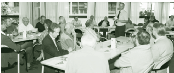
Zum Projekt „ausgewogen2015“ fanden mehrere Bürgerveranstaltungen statt.

Mehr als 210 Vorschläge, wie die anderen Produkte und Leistungen der Stadt Dornbirn effizienter und damit auch kostengünstiger abgewickelt werden können, wurden im vergangenen Halbjahr von