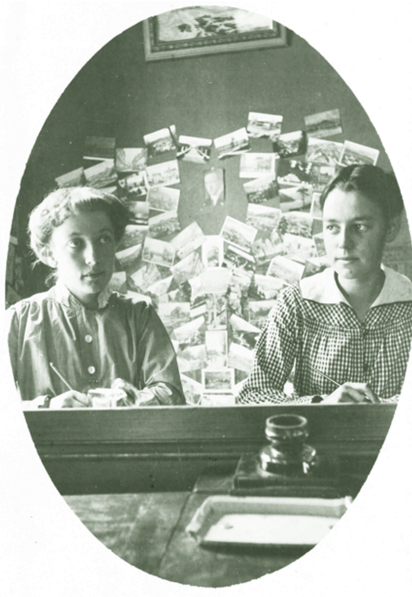
Bankangestellte der Böhmischen Union Bank um 1910

Mit und für Senioren gestaltete Zeitung der Stadt Dornbirn März 2012 / Nr. 70