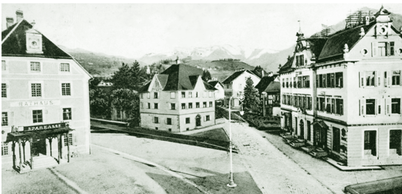
Sparkasse am Rathausplatz - um 1900

Bis nach dem zweiten Krieg war die große Dominanz der Sparkasse wohl unbestritten. Mit den vielen Zweigstellen und den Verschmelzungen von Haselstauden und Hatlerdorf hat sich die Lage etwas geändert. Die Gulden, Kronen, 2-fachen Schilling, wie die Reichsmark und Euro im Zeitablauf lassen sich kaum vergleichen. Allgemein aber kann ausgesagt werden, dass sowohl die Sparkasse, als auch Raiffeisen viel zum wirtschaftlichen Fortschritt von Dornbirn, aber auch zur Linderung mancher Not beigetragen haben.