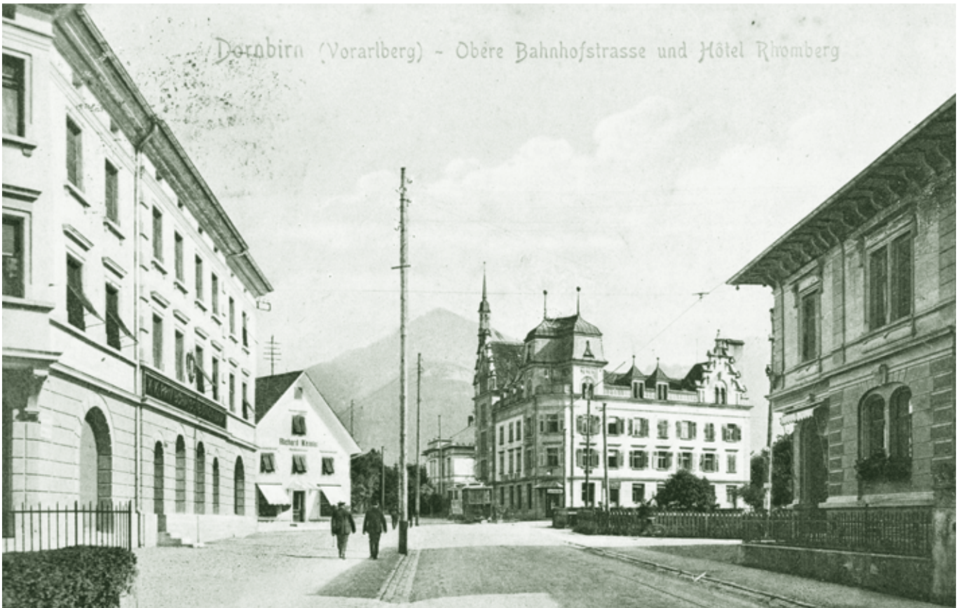
Bahnhofstraße, links Union-Bank um 1910