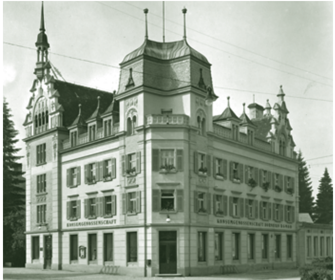
Konsum-Gebäude in der Bahnhofstraße - 1920

Bei den Suppen dominierten sättigende Varianten, wie Gersten- oder Brennsuppe. Selchfleisch oder auch Dörrobst wurde vor allem der Gerstensuppe beigemischt. Fleisch kam in der ärmeren Küche eigentlich nur dann auf den Tisch, wenn frisch geschlachtet wurde. Als Blut- und Leber-