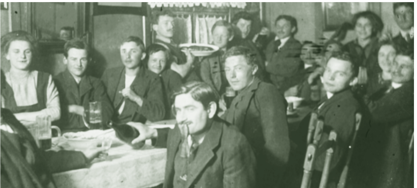
Wurstmohl - 1913

Wenn ich so zurückdenke: schön war es in der guten, alten Zeit.