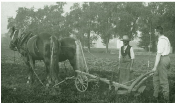
Männer beim Pflügen - 1910

Als Anfang des zwanzigsten Jahrhunderts der „Konsum“ im ehemaligen Hotel Rhomberg an der Bahnhofstraße eröffnete, war diese Entwicklung - eine Art Globalisierung - bereits Allgemeingut geworden.