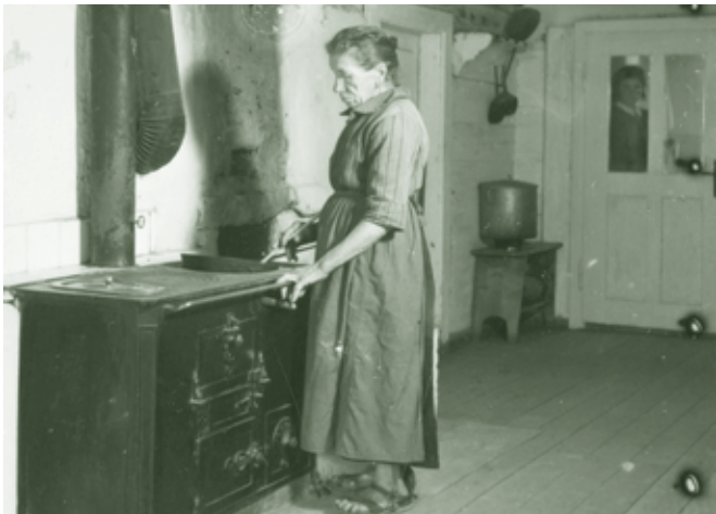
Frau am Holzherd - ca. 1940-er Jahre

Nach dem Krieg waren wir eine Großfamilie. Neben den Großeltern, Tante und Onkel hatten wir noch eine Magd, einen Knecht und manchmal einen Erntehelfer („Höuar oder Obschtsufleosar“), also etwa 10 Personen am Mittagstisch. Anfang der Fünfzigerjahre gab es noch nicht allzu viel Fleisch. Das Essen war - bezogen auf das Einkommen - sehr teuer. So gab es unter der Woche häufig Riebel mit Apfelmus, a „Muos“ (a Muos git an starko Fuoß), „Käshörnle“, a Kratzat oder Schübling und Hörnle. Die Schüblinge waren ein Problem, denn es gab noch keine Kühlschränke. Da wir ein Gasthaus hatten, kaufte die Mutter jeden Samstag zehn Paar Schüblinge, da es in der Wirtschaft Schüblingsalat, Lumpensalat oder „abgeschmalzene Schübling“ gab. Lief das Geschäft nicht so gut übers Wochenende, so wurden die Schüblinge schrumpelig und grau. Um sie zu retten, wusch man sie mit Essigwasser, nach ein, zwei weiteren Tagen hatten sie aber „Zitt“. Das heisst wir bekamen wieder einmal Schübling mit Hörnle. Daher habe ich auch für meine Kinder immer ein müdes Lächeln übrig, wenn sie es mit dem Ablaufdatum gar so genau nehmen. Alles, was in einer großen Pfanne auf dem Holzherd gekocht wurde, wurde auch aus dieser Pfanne gegessen. Jeder hatte einen eigenen Löffel und aß aus der Pfanne heraus. Ich sagte meiner Mutter, dass mir das „grusat“, wenn ich aus der gleichen Pfanne essen muss. Anscheinend grauste das meiner Mutter auch und so stellten