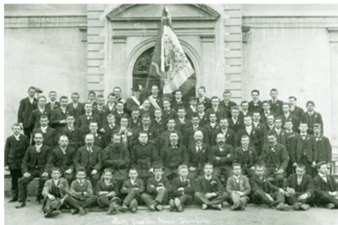
150 Jahre Kolpingsfamilie Dornbirn