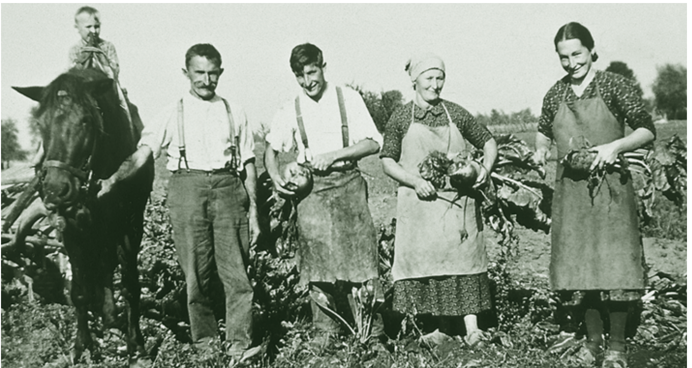
Rübenernte - 1930-er Jahre

Die „gewöhnlichen Leute“ waren froh, wenn eine Pfanne oder Schüssel voll mit diesen einfachen Gerichten auf dem Tisch stand. Die Mutter musterte in der Zeit der langen, dunklen Nächte sicher oft haushälterisch die Vorräte in der Mehltruhe, die Kalkeier in den Steinkrügen, den Topf mit Butterschmalz, den „agänzte Loab“ (angeschnitten Laib) in der großen Käse-Kiste, die Ablage der „Grumpora“ im Keller, die Sauerkrautstände, und die eingewinterten Stockrüben.