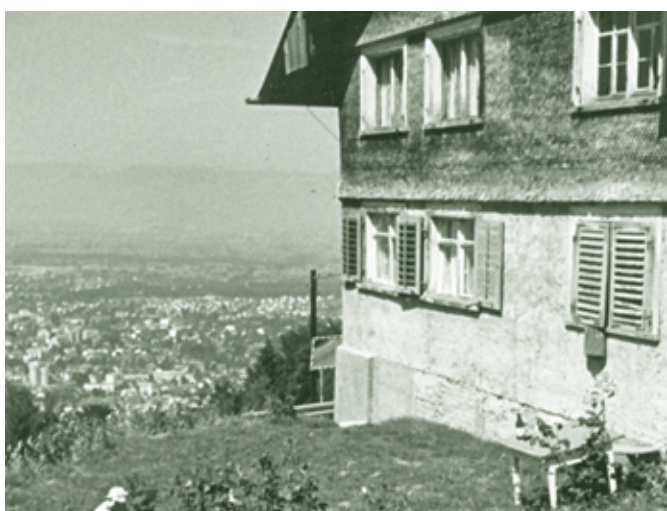
Gehr 1 - 1960-er Jahre

Nur wenige Meter südlich des oberen Fallenbergs befindet sich die Einschicht Gehr. Das alte Haus oberhalb der Bödelestraße wurde vor etlichen Jahren durch ein Neues ersetzt. Der Name „Gehr“ kommt in Dornbirn mehrfach auch in Zusammensetzungen vor und ist von einem Trinkgefäß abgeleitet. Es handelt sich in allen Fällen um dreieckförmige Grundstücke. Am Fallenberg ist die alte,