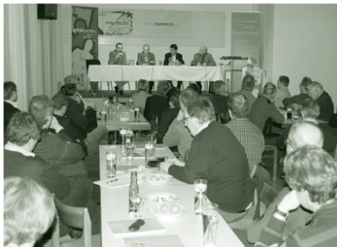
Gesellschaftspolitischer Stammtisch im Kolpinghaus

Auch heute noch sind die Ziele der katholischen Soziallehre, der Ordnung des gesellschaftlichen Zusammenlebens nach den Prinzipien der Personalität, Solidarität, Subsidiarität, Nachhaltigkeit und des Gemeinwohls aktueller denn je, so dass die Kolpingsfamilie mit ihren sozialen und gesellschaftspolitischen Aktivitäten sowie dem Betrieb des Kolpinghauses einen wichtigen Beitrag leistet.