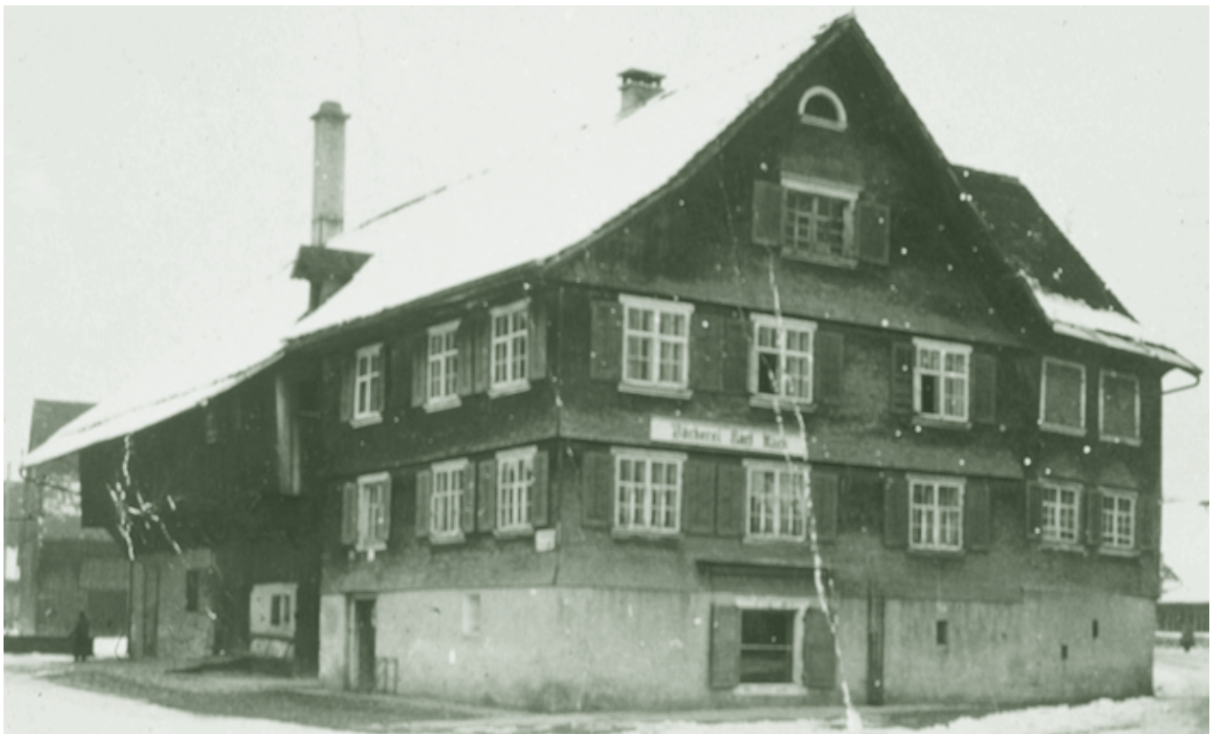
Haus Bäckerei Rick, Hatlerstraße 47 - 1947

tisch meiner Eltern zeigt heute noch die Spuren davon). Meine Mutter war immer sehr nervös, denn die eingegangenen Marken mussten mit der Menge des gelieferten Mehls übereinstimmen. Noch nervöser machte sie die Zopfbackerei, die es meiner Erinnerung nach zum ersten Mal zu Weihnachten 1946 gab. Wer einen Zopf wollte, musste Eier, Milch und etwas Fett abgeben. Wehe, wenn es da nicht für jeden „Ablieferer“ einen Zopf gegeben hätte. Die Bäcker arbeiteten am Heiligen Abend 1946 bis in den späten Abend hinein und erst dann kam das Christkind zu uns. Die ersten „Klosomä“ waren damals aus Brot und von den Kindern heißbegehrt. Sehr begehrt waren auch bis in die späten 50-er Jahre die Zopfkränze, die die Paten für ihre Gotta- und Göttekinder bei uns für Neujahr in Auftrag gaben. Die Bäcker verrichteten damals Schwerarbeit. So musste der Teig für Pärle und Krapfen händisch geschlagen werden, denn der Teig für diese Produkte sollte extrem weich sein. Weich sollten aber auch die maschinell hergestellten Teige sein.