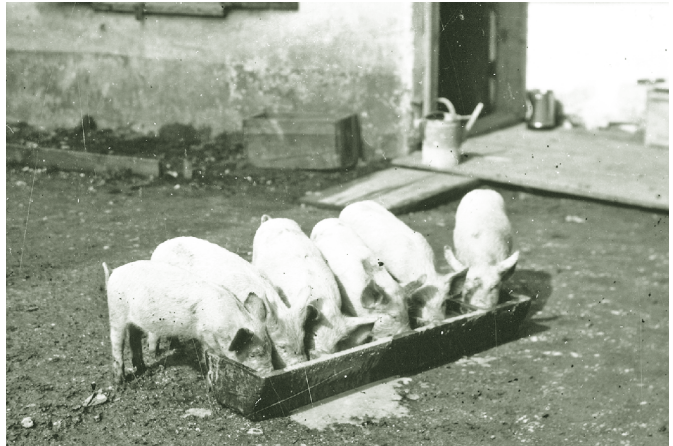
Schweine am Futtertrog 1930