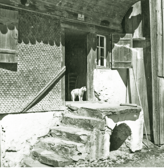
Katze in der Haldengasse - 1950