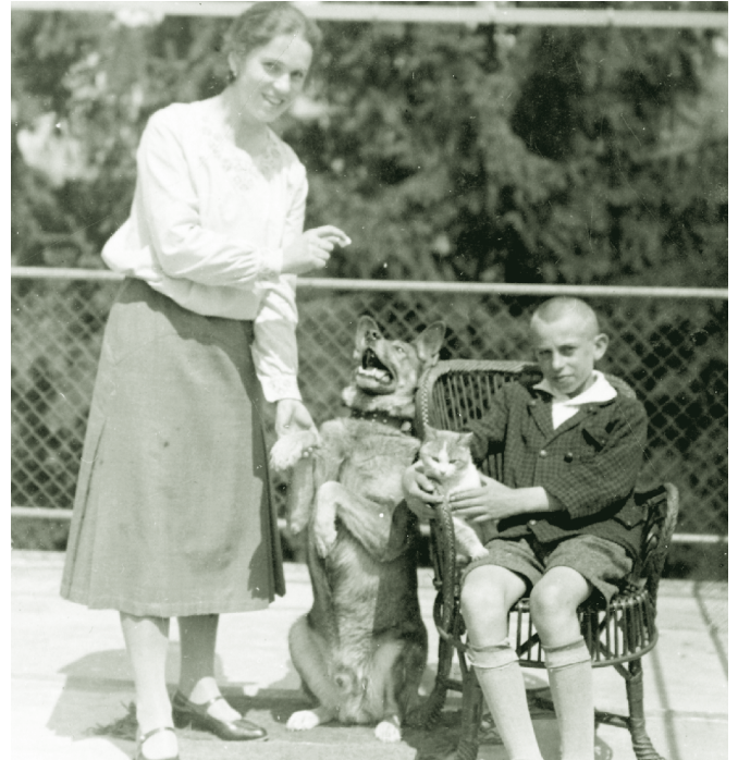
Tierdressur - 1920er

Frühjahr das Vieh nach langem Stallwinter wieder in die „Bündt“ (Hauswiese) „ausgelassen“ (ungestüm) hinausstürmte, war es naheliegend, an wilde, sich austobende Buben zu denken. Auch sie hatten manchmal das Bedürfnis, „amol richtig d'Su ussar z'lo“.