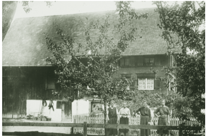
Ägtler - Mühlebacherstraße 17 um 1920

Die Patronin Agatha war eine Märtyrerin aus Catania in Sizilien, die man hier sehr verehrt hat. Bis heute wird in den Kirchen an ihrem Tag (5. Februar) Brot gesegnet. Man hat wohl ihre Attribute auf einem Teller für Brote gehalten. Tatsächlich sollen das aber die Brüste darstellen, deren man die Heilige qualvoll beraubt hat.