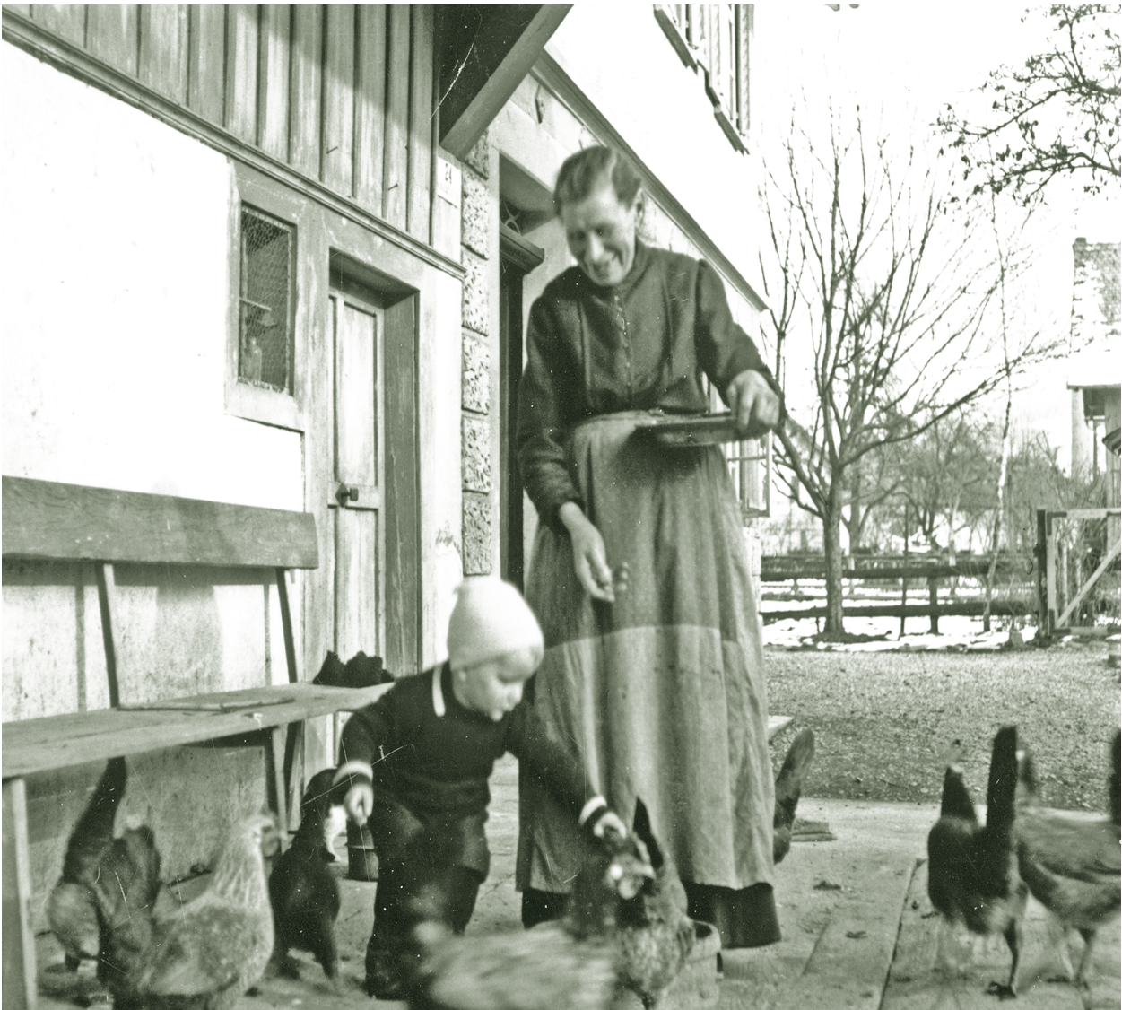
Beim Hühner Füttern in der Schmelzhütten um 1920

Mit und für Senioren gestaltete Zeitung der Stadt Dornbirn September 2011 / Nr. 68