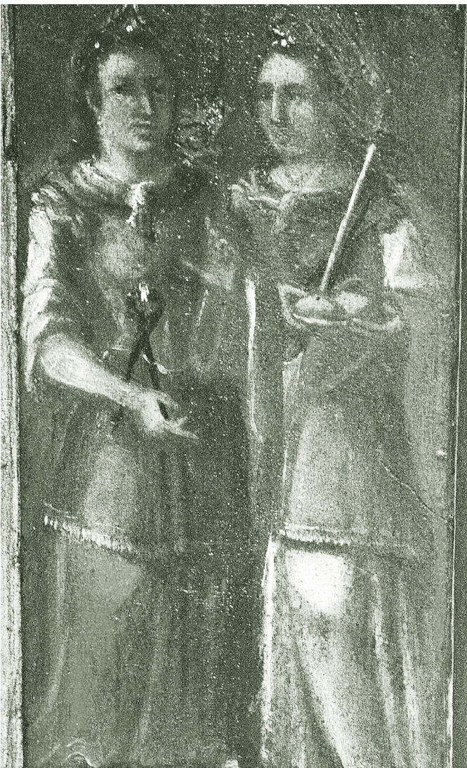
„Zahnbild“ oder „Hatlerbild“ der Hl. Agath + Hl. Apollonia“

Man ist fast im ganzen Land der Meinung, dass es die meisten Hausnamen in Lustenau gebe, wo man sich bei den vielen Hämmerle, Bösch und Grabher sonst nicht zurechtfindet. Wenn man aber die Akten des Gerichtsbezirks Dornbirn durchsieht, der einst bis zum Bodensee reichte, fällt neben Lustenau nicht nur Dornbirn mit vielen, eigentümlichen Volksnamen auf, sondern auch in Hohenems und Höchst gibt es viele, originelle Beispiele. Weil diese von Personennamen, Berufen oder Eigenschaften abgeleitet sind, findet man ähnliche Namen an verschiedenen Orten fast gleichlautend. Dass innerhalb der Dornbirner Viertel ein Name