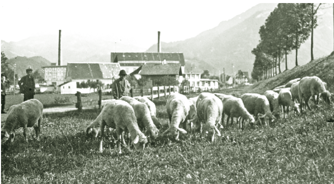
Beim Schafehüten in der Schmelzhütten - 1930

Wer früher tagtäglich den Stall ausmistetet, als „Pfister“, „Kouar“ (Alphirte) das Vieh aus- und zusammentreiben musste, als Hirtenbub die kalten Füße in einem Kuohdättor aufwärmte, den „Hodar“ Stier der Kuh zuführte - man hatte zu den Tieren eine nüchterne Beziehung, die sich zuweilen in Kraftausdrücken und anzüglichen Vergleichen mit den Menschen widerspiegelte: „Beost doch du a Kalb“! „Bion i a blöde Kuoh gsi!“ „An ghöriga Molle“ (Stier, sturer Kraftprotz)... Wenn im