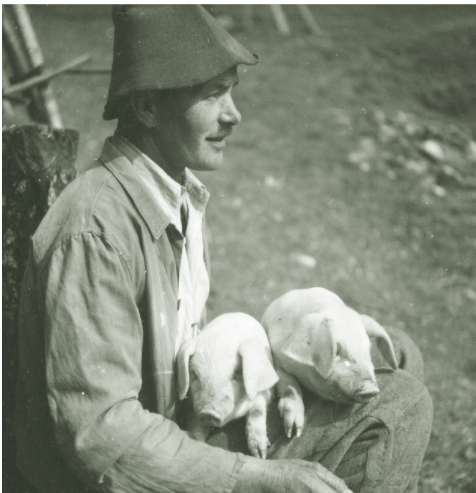
Schweinehirt - 1950er

Die Lockrufe. „Mule-Muh“ (für Kühe und Kälble), „Blä-blä“ (für Lämmchen), „Häss-häss“ (für Schweinchen), „Giz-giz“ (für Geißlein), „Bibile“ (für Kücken). In ihnen ist noch in einem hohen Maß die herzliche Nahbeziehung des Menschen zu den Tieren lebendig erhalten. Sie war zweifellos ein entscheidender Grund dafür, dass Tiere zu Freunden und Helfern der Menschen, dass sie zahme Haustiere wurden.