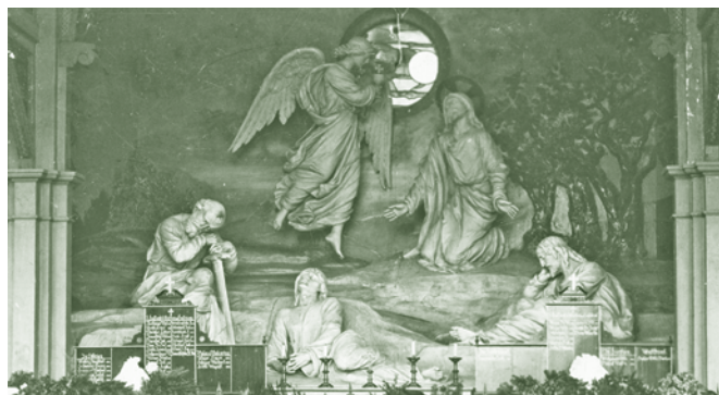
Kriegergrab mit Ölberg, Friedhof Hatlerdorf - 1. Weltkrieg