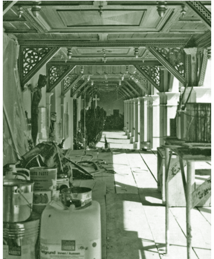
Restaurierung der Arkaden - 1980er