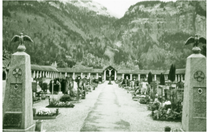
Eingang zum Hatler Friedhof - um 1950

Im Lauf der Zeit wurden an den Rändern aller Felder Familiengrabstätten geschaffen. Ein sehr großes Feld nahmen die Kindergräber auf der linken Seite ein. Durch den enormen Fortschritt der Medizin, aber auch durch die Bestattung von Kindern in Familiengräbern ist das Feld jetzt klein geworden.