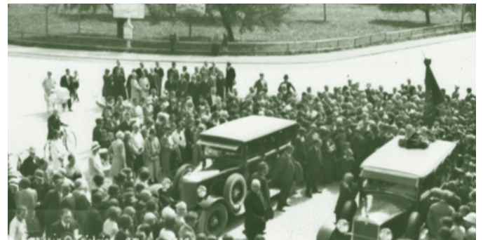
Überführung von Frau Marie Leibfried nach Konstanz - 1930

In der orthodoxen Kirche wird die Feuerbestattung bis heute abgelehnt. Auch im Judentum und im Islam ist die Verbrennung des toten Körpers grundsätzlich verboten.