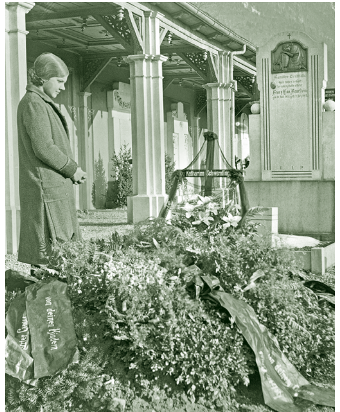
Hatler Friedhof - 1920