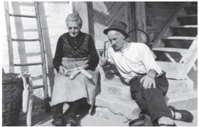
Arbeiten auf der Stiege