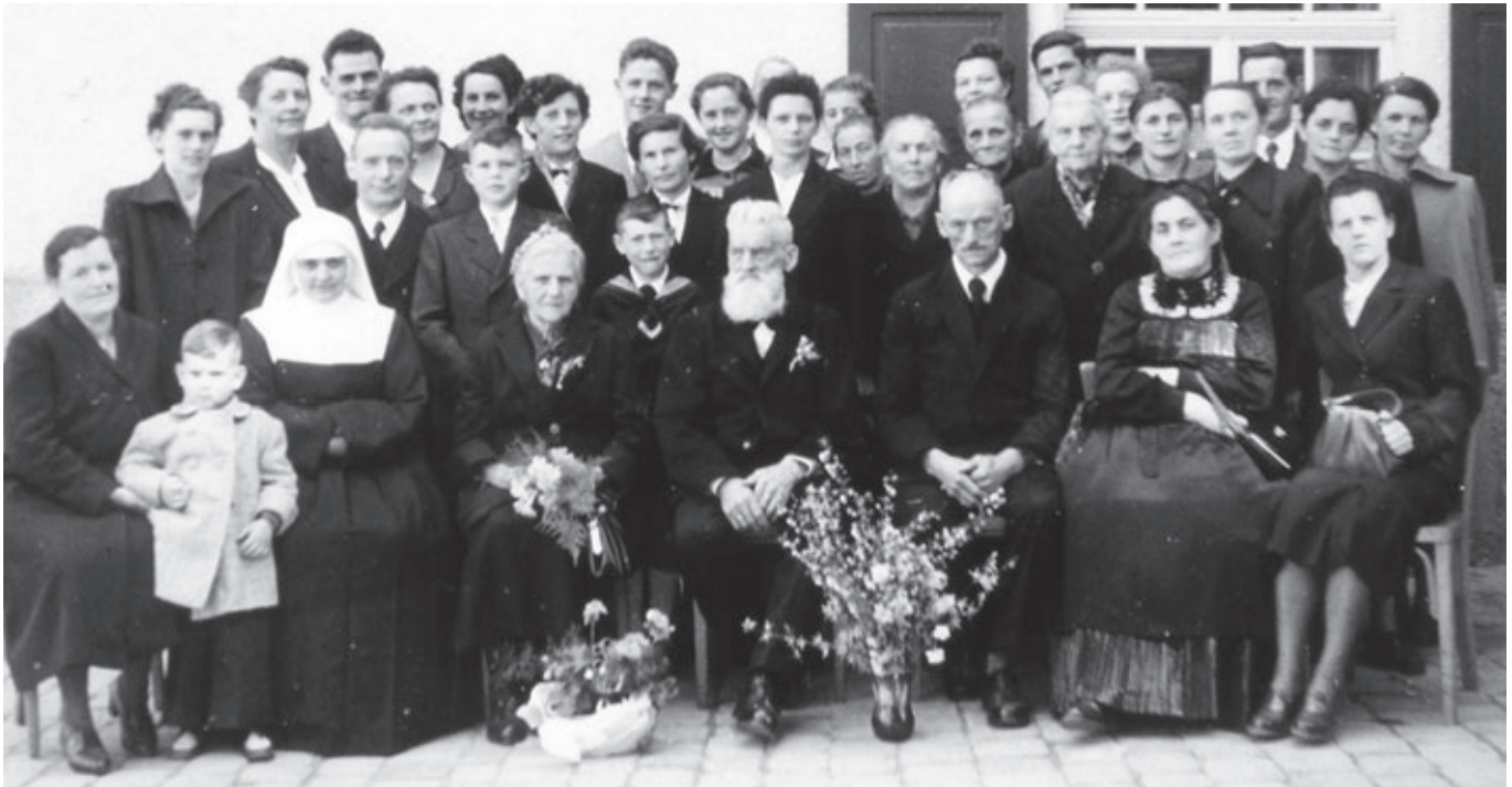
Goldene und Silberne Hochzeit, 1953